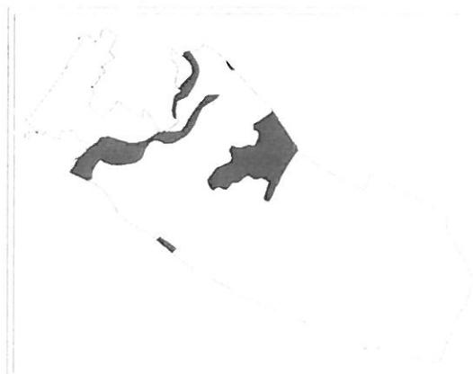
Tervezett természeti területek