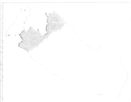
Nagyvízi meder területe