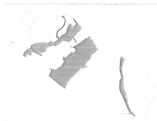
Ökológiai folyosó területe