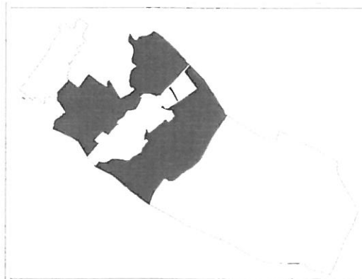
Natura 2000 SPA (madárvédelmi) terület