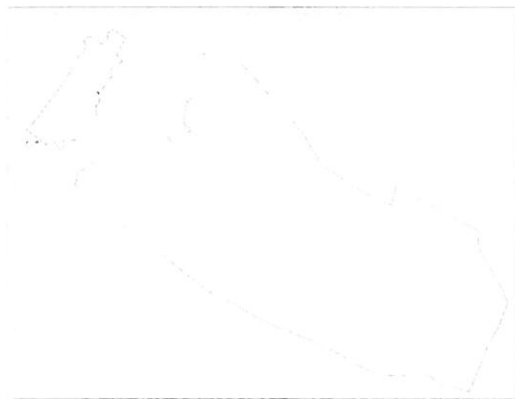
ökológiai hálózat területe