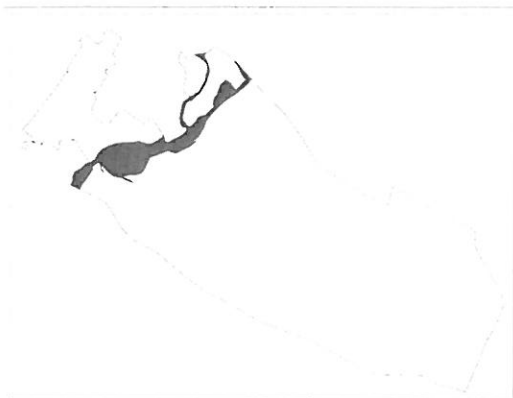
Natura 2000 SCI (különleges természetmegőrzési) terület